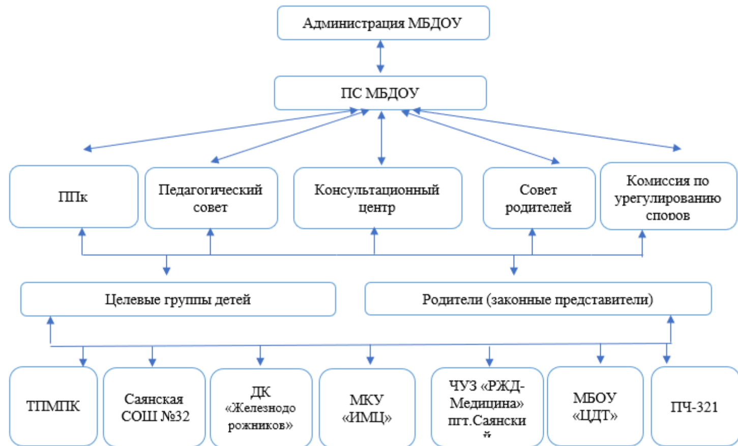
Модель психологической службы МБДОУ «Саянский детский сад «Волшебный град»